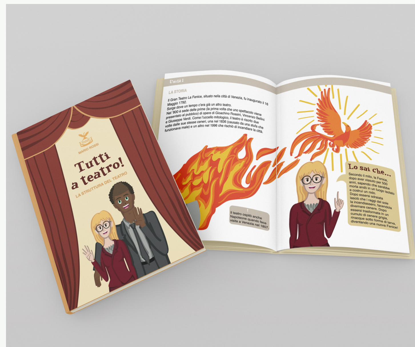
Unità 1-La Storia pp. 7-8