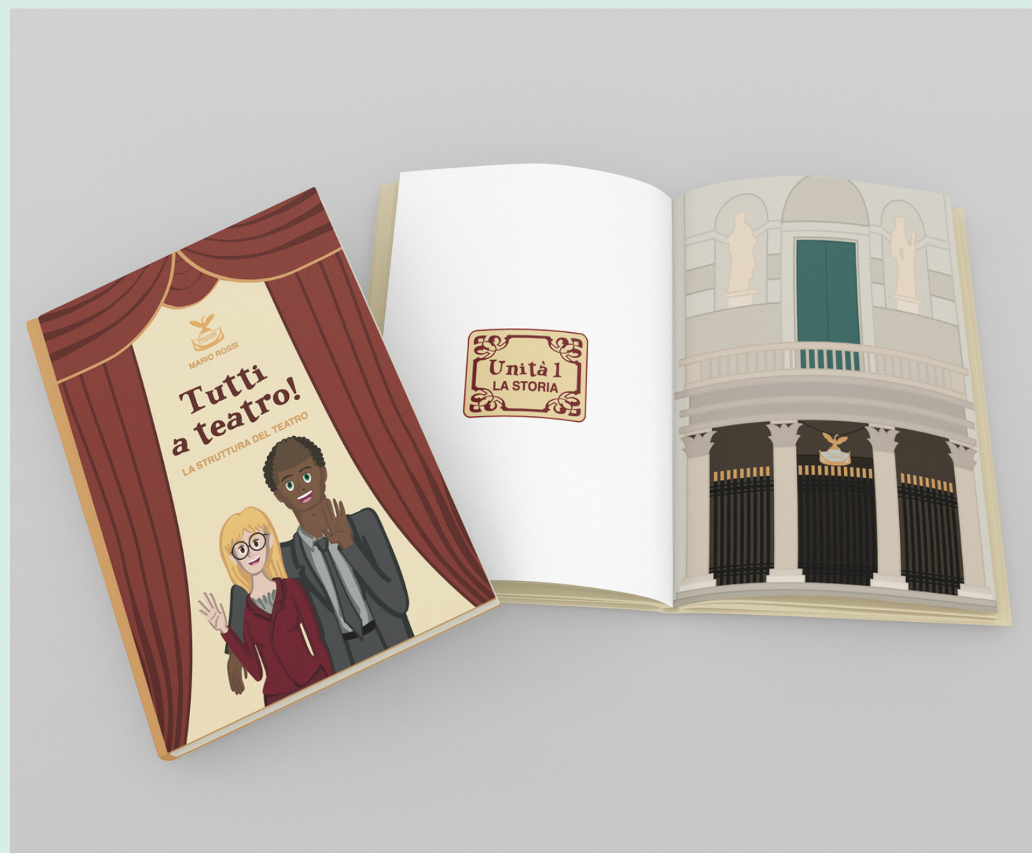
Unità 1-La Storia pp. 5-6